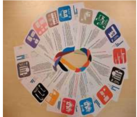
Klimaatwinkelen met klimaatkaarten

Het blijft echter van belang datgene te doen dat wél binnen de gemeentelijke mogelijkheden ligt. Binnen die mogelijkheden kan vervolgens besloten worden hoe snel en hoe intensief dat wordt gedaan. Om te peilen hoe hier in de raad over gedacht wordt is de raadsessie "klimaatwinkelen" georganiseerd in 2015. Tijdens die sessie is gesproken over de huidige Hattemse energiesituatie. En wat de discrepantie is tussen de huidige situatie en de gewenste situatie (klimaatneutrale energievoorziening). Duidelijk is dat ondanks de inspanningen van overheid, bedrijven en inwoners, de afgelopen jaren nog geen trendbreuk is ontstaan. Het energieverbruik blijft (enigszins vertraagd) toenemen. De opwekking van duurzame energie blijft daarbij achter. Onderstaande grafiek (bron: regionale routekaart ) laat zien hoe de energievraag zich momenteel nog verhoudt tot het aanbod van duurzame energie.