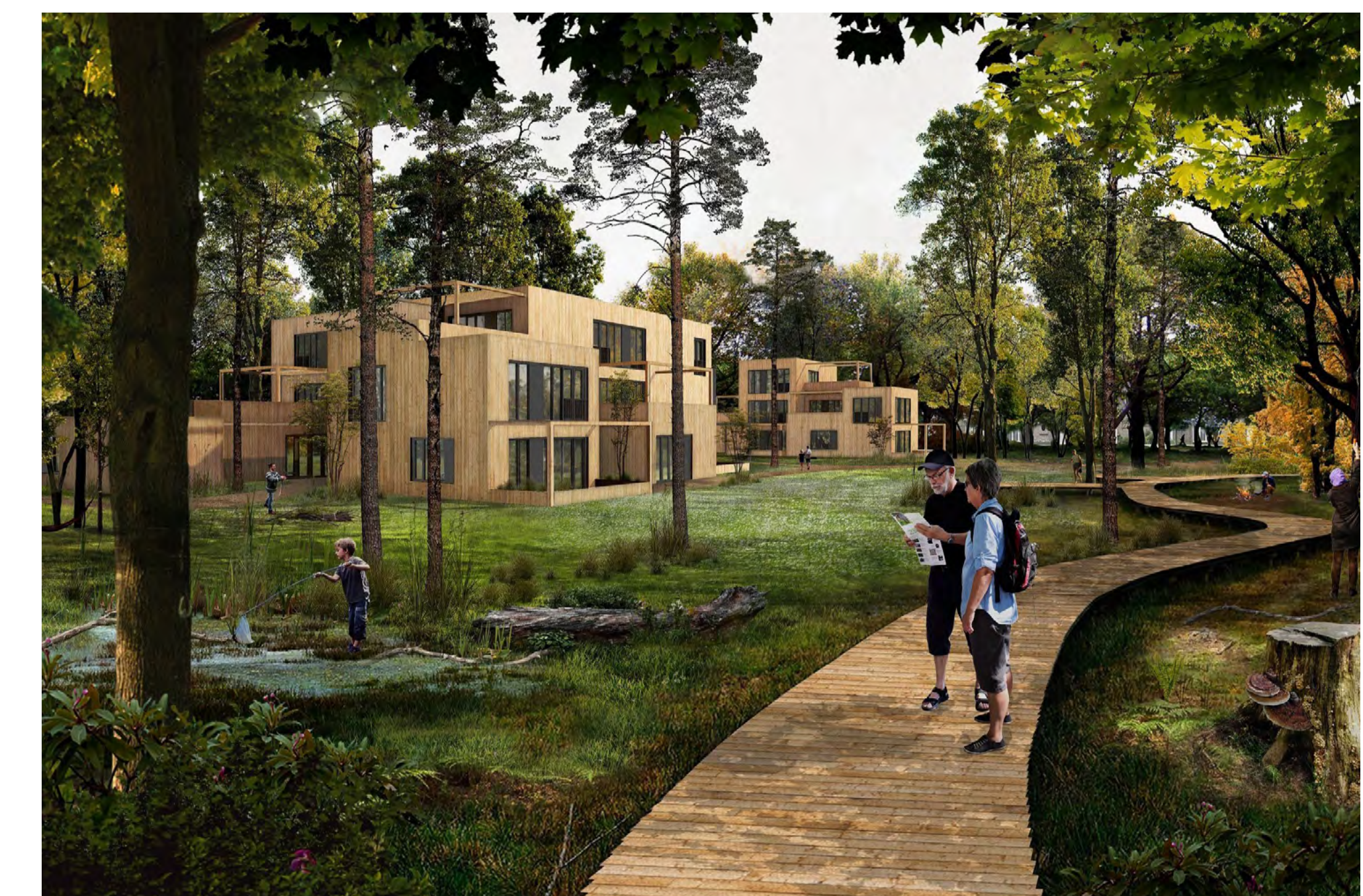
Impressies van verschillende typen flexwoningen.